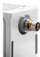
Gewindeanschluss an Ventilheizkörpern