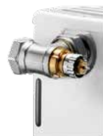
Gewindeanschluss an konventionellen Heizkörpern