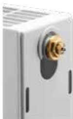
Gewindeanschluss an Ventilheizkörpern