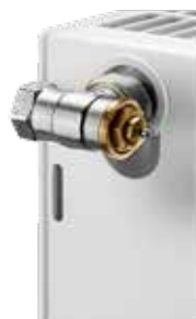
Gewindeanschluss an konventionellen Heizkörpern